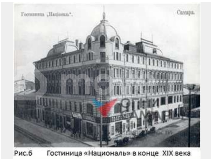
Рис.6 Гостиница «Националь» в конце XIX века